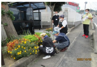
バス停前をきれいにしてい ただきました