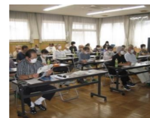
健康講演会の様子