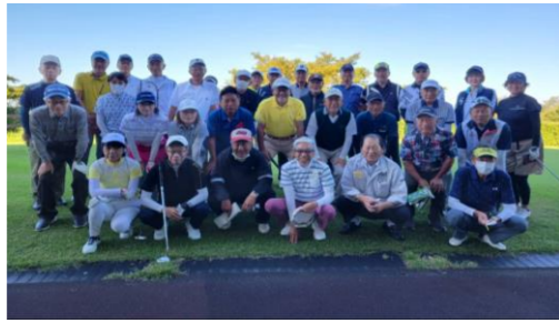
秋晴れのなかの集合写真

当日はグリーンコンディションも良く、ベスグロの争いも激しく、各カートのモニターに出る他のメンバーのスコアに歓声が上がりました。