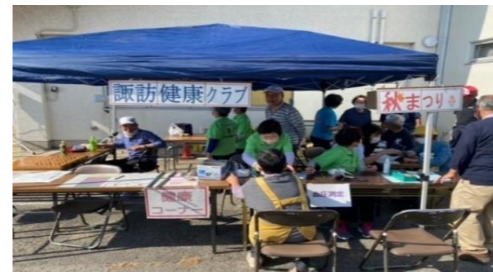
健康クラブ 健康チェック