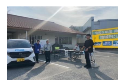
地域モビリティの体験乗車