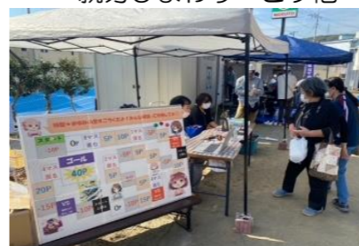
まゆみの里 ゲーム、さつま芋詰め放題