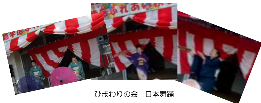
ひまわりの会 日本舞踊