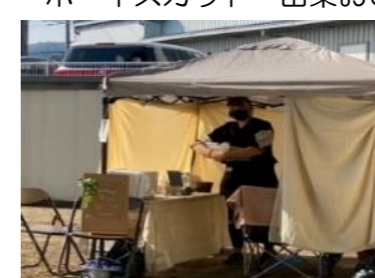
ひとやすみ ハンドマッサージ