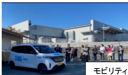
モビリティ出発式