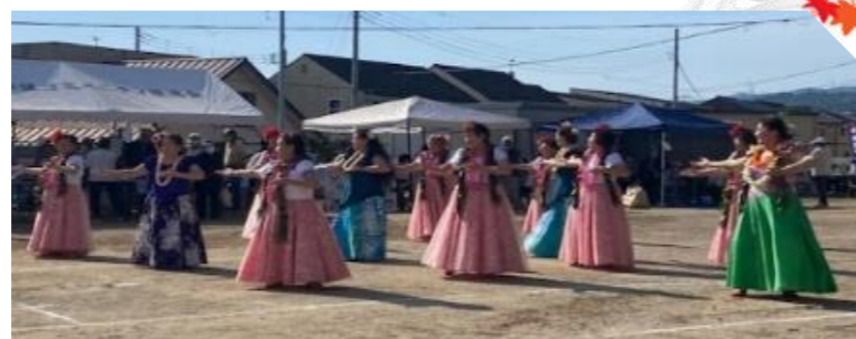
メレフラ フラダンス