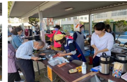
協力員 フランクフルト他