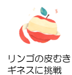
リンゴの皮むきギネスに挑戦