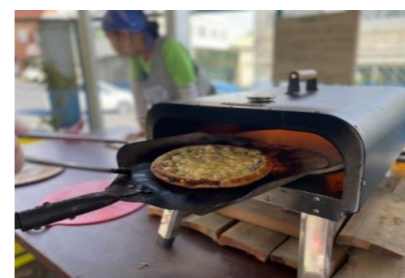
就労ひまわり ピザ他