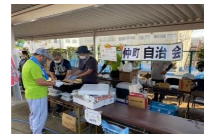
仲町自治会 生ビール他