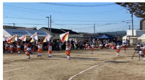
すけ川幼稚園 鼓笛隊