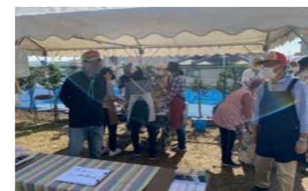
ボーイスカウト 山菜おこわ