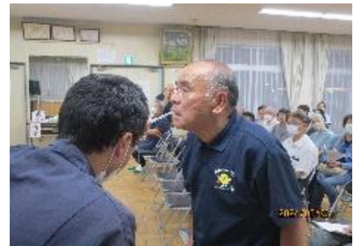
舌圧測定検査中 舌圧測定検査とは舌の筋力を定量的に評価するための検査です