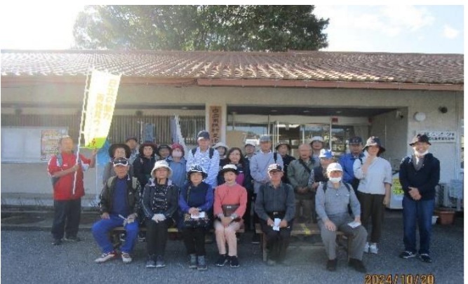
出発前 諏訪交流センターで