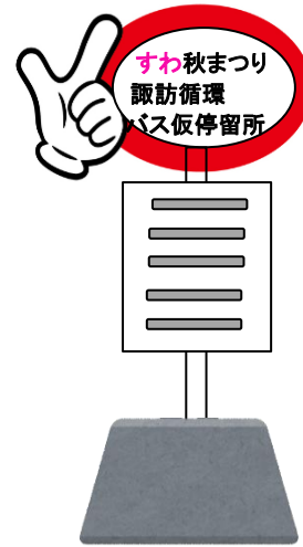
秋まつり 臨時バス停